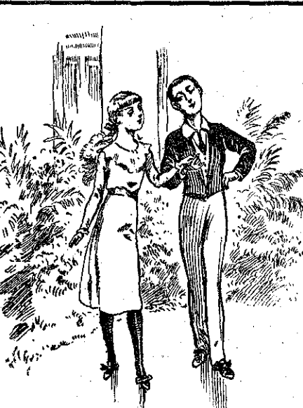
Τά δύο παιδιά άρχισαν νά έκτελούν δύσκολου χορού... (Σελ. 199, στ. β΄)